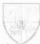
Consiliul Județean Harghita Harghita Megye Tanácsa