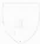
Consiliul Județean Harghita Harghita Megye Tanácsa