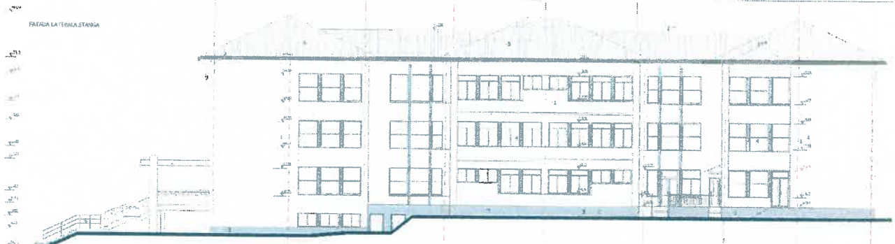
FATADA LA TERASA STANGA